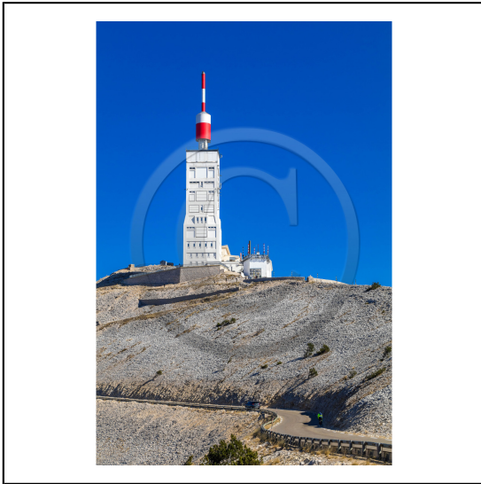
Vaucluse (84) , Mont Ventoux, surnommé le Géant de Provence ou le Mont Chauve, il est classé réserve de biosphère par l'UNESCO et site Natura 2000, tour de l'observatoire // Vaucluse (84), Mont Ventoux, nicknamed the Giant of Provence or Bald Mountain, classified biosphere reserve by UNESCO and Natura 2000 site