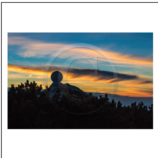
Vaucluse (84) , Mont Ventoux, surnommé le Géant de Provence ou le Mont Chauve, il est classé réserve de biosphère par l'UNESCO et site Natura 2000, tour de l'Observatoire et radôme // Vaucluse (84), Mont Ventoux, nicknamed the Giant of Provence or Bald Mountain, classified biosphere reserve by UNESCO and Natura 2000 site, Observatory tower and radome