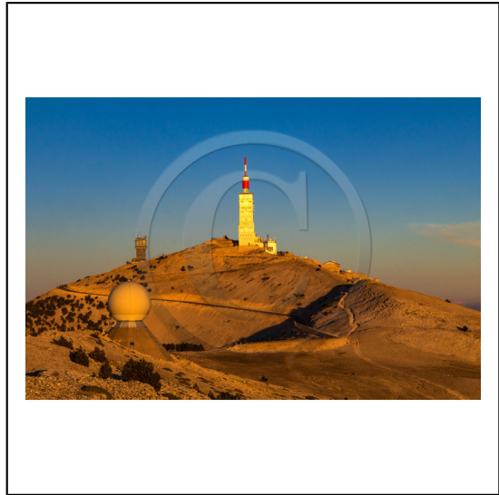
Vaucluse (84) , Mont Ventoux, surnommé le Géant de Provence ou le Mont Chauve, il est classé réserve de biosphère par l'UNESCO et site Natura 2000, tour de l'Observatoire et radôme // Vaucluse (84), Mont Ventoux, nicknamed the Giant of Provence or Bald Mountain, classified biosphere reserve by UNESCO and Natura 2000 site, Observatory tower and radome