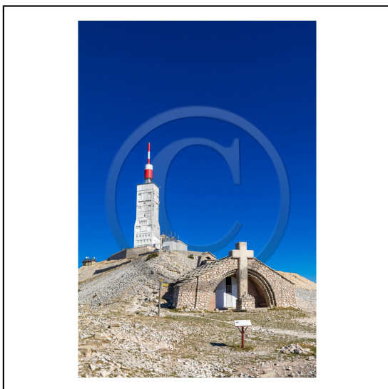
Vaucluse (84) , Mont Ventoux, surnommé le Géant de Provence ou le Mont Chauve, il est classé réserve de biosphère par l'UNESCO et site Natura 2000, chapelle Sainte Croix // Vaucluse (84), Mont Ventoux, nicknamed the Giant of Provence or Bald Mountain, classified biosphere reserve by UNESCO and Natura 2000 site, chapel Sainte Croix