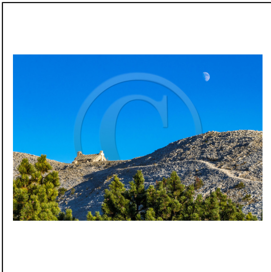
Vaucluse (84) , Mont Ventoux, surnommé le Géant de Provence ou le Mont Chauve, il est classé réserve de biosphère par l'UNESCO et site Natura 2000, chapelle Sainte Croix // Vaucluse (84), Mont Ventoux, nicknamed the Giant of Provence or Bald Mountain, classified biosphere reserve by UNESCO and Natura 2000 site, chapel Sainte Croix