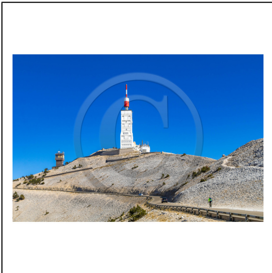
Vaucluse (84) , Mont Ventoux, surnommé le Géant de Provence ou le Mont Chauve, il est classé réserve de biosphère par l'UNESCO et site Natura 2000, tour de l'observatoire // Vaucluse (84), Mont Ventoux, nicknamed the Giant of Provence or Bald Mountain, classified biosphere reserve by UNESCO and Natura 2000 site