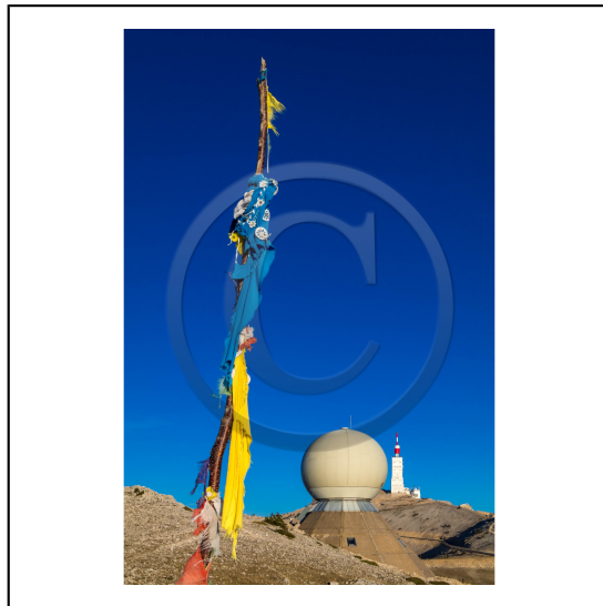
Vaucluse (84) , Mont Ventoux, surnommé le Géant de Provence ou le Mont Chauve, il est classé réserve de biosphère par l'UNESCO et site Natura 2000, tour de l'Observatoire et radôme // Vaucluse (84), Mont Ventoux, nicknamed the Giant of Provence or Bald Mountain, classified biosphere reserve by UNESCO and Natura 2000 site, Observatory tower and radome