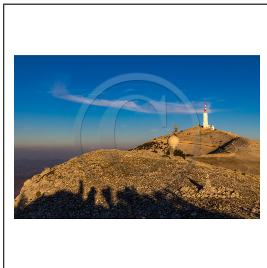
Vaucluse (84) , Mont Ventoux, surnommé le Géant de Provence ou le Mont Chauve, il est classé réserve de biosphère par l'UNESCO et site Natura 2000, tour de l'Observatoire et radôme // Vaucluse (84), Mont Ventoux, nicknamed the Giant of Provence or Bald Mountain, classified biosphere reserve by UNESCO and Natura 2000 site, Observatory tower and radome