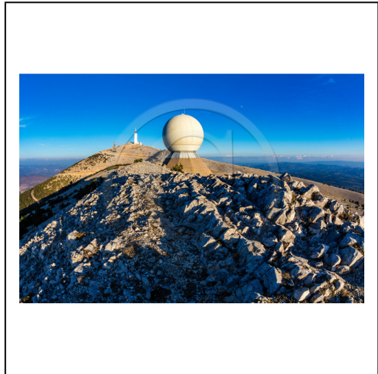
Vaucluse (84) , Mont Ventoux, surnommé le Géant de Provence ou le Mont Chauve, il est classé réserve de biosphère par l'UNESCO et site Natura 2000, tour de l'Observatoire et radôme // Vaucluse (84), Mont Ventoux, nicknamed the Giant of Provence or Bald Mountain, classified biosphere reserve by UNESCO and Natura 2000 site, Observatory tower and radome