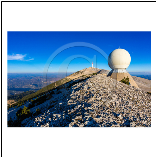
Vaucluse (84) , Mont Ventoux, surnommé le Géant de Provence ou le Mont Chauve, il est classé réserve de biosphère par l'UNESCO et site Natura 2000, tour de l'Observatoire et radôme // Vaucluse (84), Mont Ventoux, nicknamed the Giant of Provence or Bald Mountain, classified biosphere reserve by UNESCO and Natura 2000 site, Observatory tower and radome