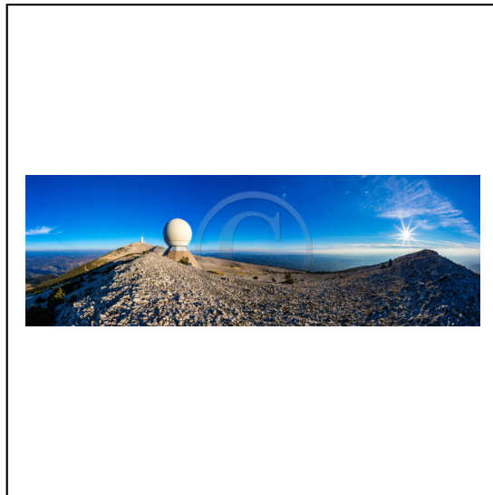
Vaucluse (84) , Mont Ventoux, surnommé le Géant de Provence ou le Mont Chauve, il est classé réserve de biosphère par l'UNESCO et site Natura 2000, tour de l'Observatoire et radôme // Vaucluse (84), Mont Ventoux, nicknamed the Giant of Provence or Bald Mountain, classified biosphere reserve by UNESCO and Natura 2000 site, Observatory tower and radome