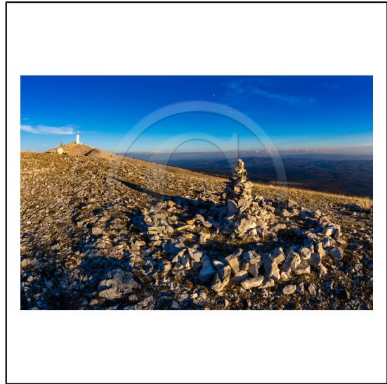
Vaucluse (84) , Mont Ventoux, surnommé le Géant de Provence ou le Mont Chauve, il est classé réserve de biosphère par l'UNESCO et site Natura 2000, cairn // Vaucluse (84), Mont Ventoux, nicknamed the Giant of Provence or Bald Mountain, classified biosphere reserve by UNESCO and Natura 2000 site