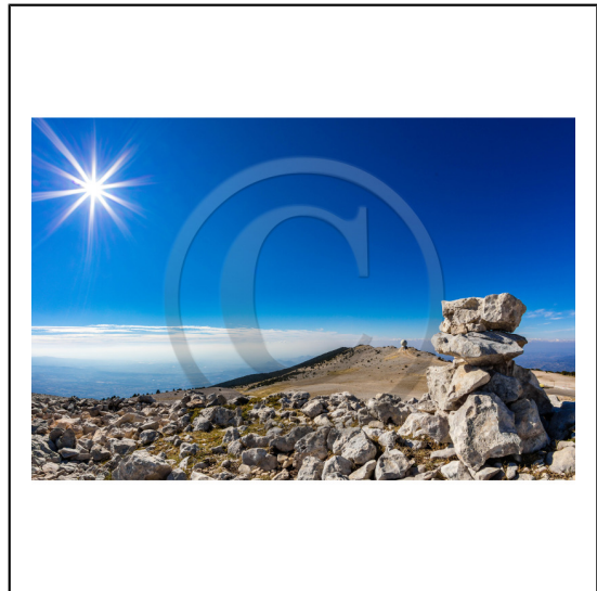
Vaucluse (84) , Mont Ventoux, surnommé le Géant de Provence ou le Mont Chauve, il est classé réserve de biosphère par l'UNESCO et site Natura 2000, cairn // Vaucluse (84), Mont Ventoux, nicknamed the Giant of Provence or Bald Mountain, classified biosphere reserve by UNESCO and Natura 2000 site