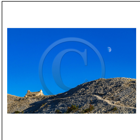
Vaucluse (84) , Mont Ventoux, surnommé le Géant de Provence ou le Mont Chauve, il est classé réserve de biosphère par l'UNESCO et site Natura 2000, chapelle Sainte Croix // Vaucluse (84), Mont Ventoux, nicknamed the Giant of Provence or Bald Mountain, classified biosphere reserve by UNESCO and Natura 2000 site, chapel Sainte Croix