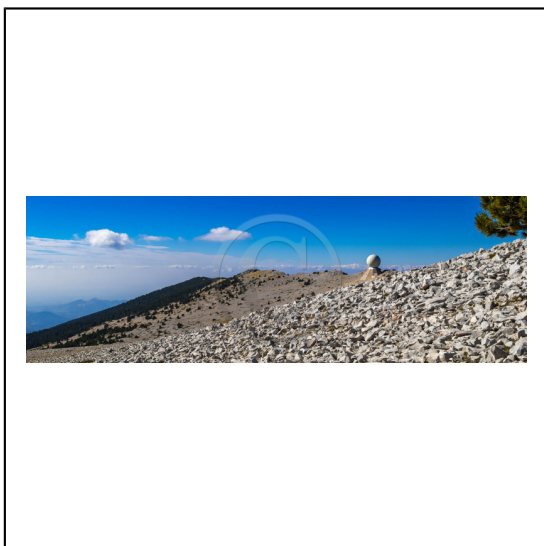
Vaucluse (84) , Mont Ventoux, surnommé le Géant de Provence ou le Mont Chauve, il est classé réserve de biosphère par l'UNESCO et site Natura 2000, tour de l'Observatoire et radôme // Vaucluse (84), Mont Ventoux, nicknamed the Giant of Provence or Bald Mountain, classified biosphere reserve by UNESCO and Natura 2000 site, Observatory tower and radome