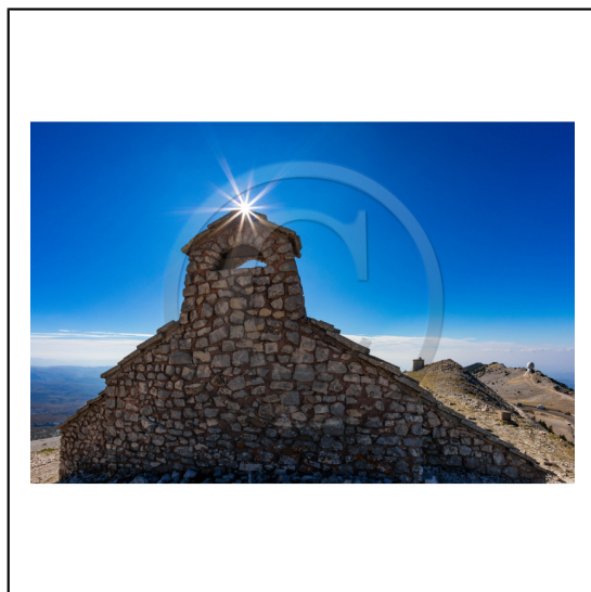
Vaucluse (84) , Mont Ventoux, surnommé le Géant de Provence ou le Mont Chauve, il est classé réserve de biosphère par l'UNESCO et site Natura 2000, chapelle Sainte Croix // Vaucluse (84), Mont Ventoux, nicknamed the Giant of Provence or Bald Mountain, classified biosphere reserve by UNESCO and Natura 2000 site, chapel Sainte Croix