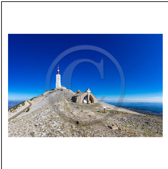
Vaucluse (84) , Mont Ventoux, surnommé le Géant de Provence ou le Mont Chauve, il est classé réserve de biosphère par l'UNESCO et site Natura 2000, chapelle Sainte Croix // Vaucluse (84), Mont Ventoux, nicknamed the Giant of Provence or Bald Mountain, classified biosphere reserve by UNESCO and Natura 2000 site, chapel Sainte Croix