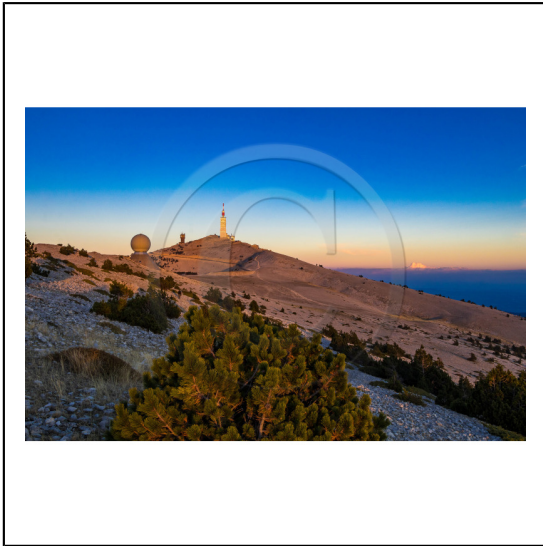
Vaucluse (84) , Mont Ventoux, surnommé le Géant de Provence ou le Mont Chauve, il est classé réserve de biosphère par l'UNESCO et site Natura 2000, tour de l'Observatoire et radôme // Vaucluse (84), Mont Ventoux, nicknamed the Giant of Provence or Bald Mountain, classified biosphere reserve by UNESCO and Natura 2000 site, Observatory tower and radome