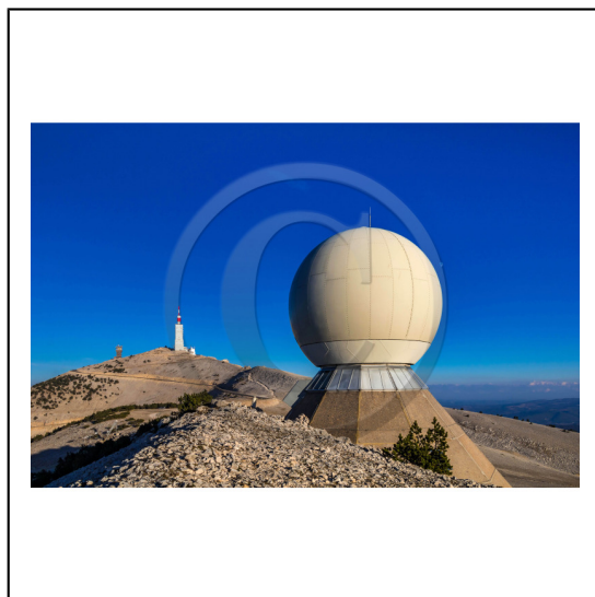
Vaucluse (84) , Mont Ventoux, surnommé le Géant de Provence ou le Mont Chauve, il est classé réserve de biosphère par l'UNESCO et site Natura 2000, tour de l'Observatoire et radôme // Vaucluse (84), Mont Ventoux, nicknamed the Giant of Provence or Bald Mountain, classified biosphere reserve by UNESCO and Natura 2000 site, Observatory tower and radome