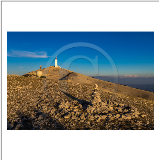
Vaucluse (84) , Mont Ventoux, surnommé le Géant de Provence ou le Mont Chauve, il est classé réserve de biosphère par l'UNESCO et site Natura 2000, tour de l'Observatoire et radôme, cairn // Vaucluse (84), Mont Ventoux, nicknamed the Giant of Provence or Bald Mountain, classified biosphere reserve by UNESCO and Natura 2000 site, Observatory tower and radome